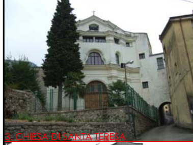
3. CHIESA DI SANTA TERESA