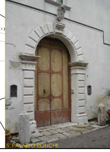
5. PALAZZO RONCHI