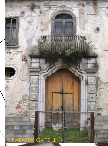
4. PALAZZO GARZILLI