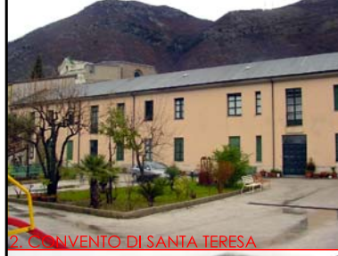
2. CONVENTO DI SANTA TERESA