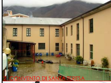
2. CONVENTO DI SANTA TERESA