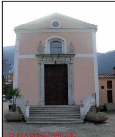
1. CHIESA DI SANT'ANTONIO