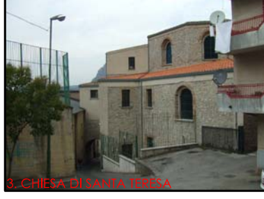
3. CHIESA DI SANTA TERESA