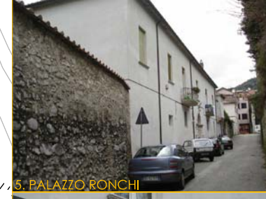
5. PALAZZO RONCHI