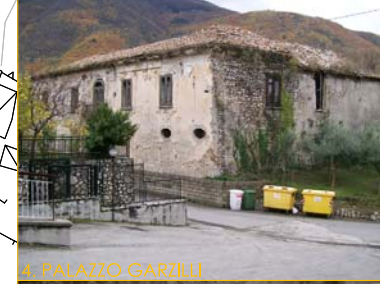
4. PALAZZO GARZILLI