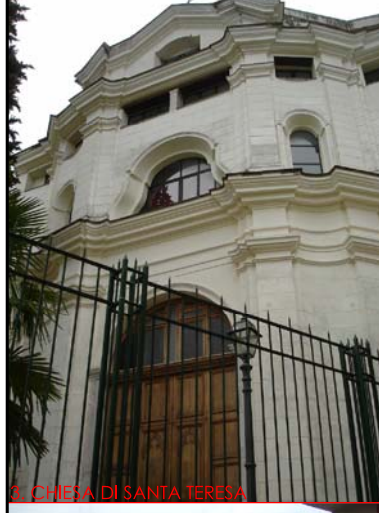
3. CHIESA DI SANTA TERESA